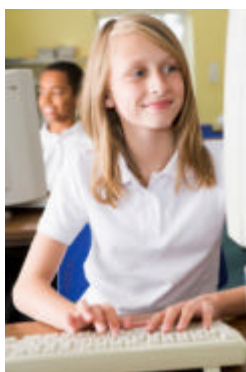
Schülerin bearbeitet die AG-Fachseite mit SchoolVision5

Foyer, Lehrerzimmer, in der Mensa/Cafeteria oder an externe Standorte der Schule.